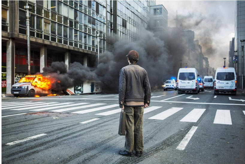
Protest gele hesjes